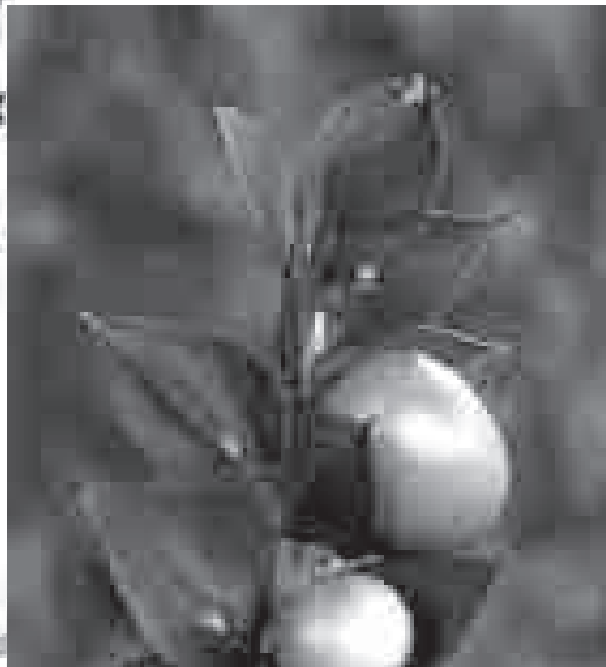
Galzeran ( Ruscus aculeatus )

Les festes de Nadal han estat sempre, a la nostra societat, unes dates assenyalades de solidaritat i de celebració amb la família. Cada vegada més, però, el Nadal més tradicional s'ha convertit en un temps de consum, majoritàriament poc controlat. L'augment del consumisme (compra de menjar i regals), de la mobilitat (desplaçaments als comerços, cases de familiars,...), de la despesa energètica (llums de Nadal, calefaccions,...) i la utilització d'ornaments naturals (avets, molsa pel pessebre,...) han fet que oblidem el respecte pel medi ambient.