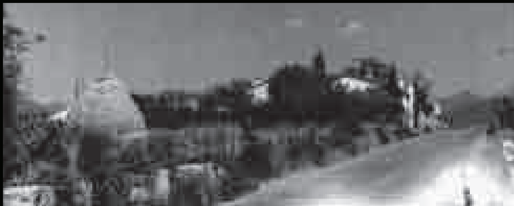
Carrer de Llerona, abans carrer de Rovira de Villar