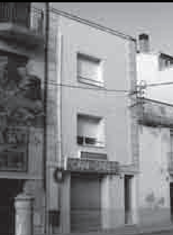
Cap als anys 40, a Can Carlí hi havia el barber del carrer de Llerona